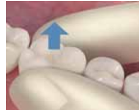
13. Irrota kruunu varovasti.