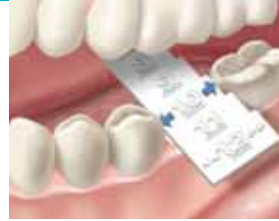
1. Valitse mesio-distaalietäisyyttä vastaava kruunu kruunun mittatulkilla. Mittatulkki on kertakäyttöinen.

Käytä aina suojakäsineitä työskennellessäsi valokovettamattomien Protemp väliaikaiskruunujen kanssa.