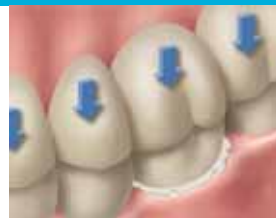
18. Aseta kruunu hitaasti paikalleen painamalla sitä kevyesti peukalolla. Anna ylimääräisen sementin puristua ulos kevyessä purennassa.