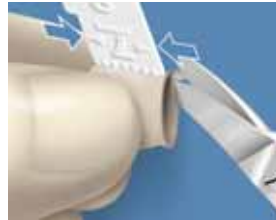
5. Poistettava ylimäärä määritellään mittaamalla viereisten hampaiden keskimääräinen korkeus. Ienrajan ylimäärät ja kruunun oikea pituus leikataan kruunusaksilla.