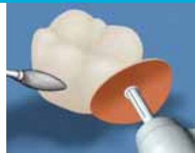
15. Viimeistele kovametalliporalla, samettitimanilla ja 3M™ ESPE™ Sof-Lex™ XT kiekkojen avulla. Kiillota kuivalla musliiniekolla tai kiillotusharjalla.