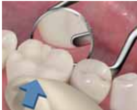
10. Sovita linguaalireuna. Linguaalireunaa muotoiltaessa paina sormella kevyesti bukkaalipuolelta, jottei kruunu siirry paikaltaan.