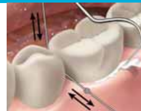
19. Poista sementtylimäärät. Käytä hammaslankaa approksiimaalialueilla. Tarkista sulkus.