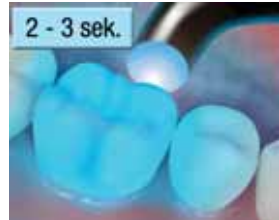
11. Pikakoveta linguaalipuolta 2 - 3 sekuntia.