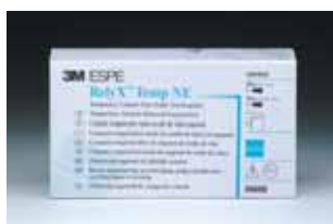
RelyX™ Temp NE väliaikassementti 56660