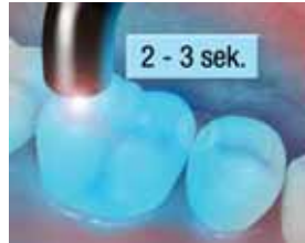
12. Pikakoveta purupintaa 2 - 3 sekuntia.