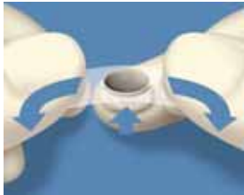
3. Venytä suojakelmua peukaloiden ja etusormien välissä ja paina kruunu irti suojakelmusta.